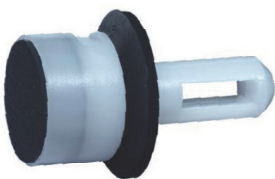
Art. 8G12-6 Stößel Dichtungskit