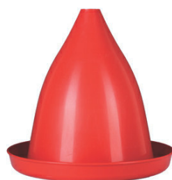
Art. 36-T Hängetränke Behälter