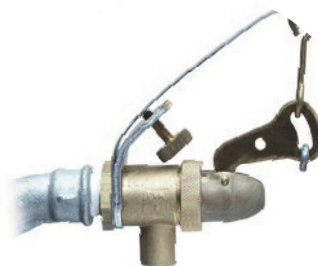
Art. 6A Blattfeder Ersatzventil