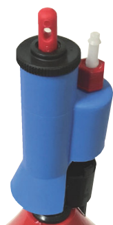
Art. 36_JBV Ersatzventil Niederdruck