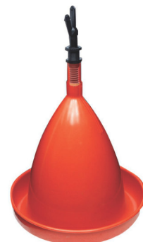
Art. 36- Ersatzbehälter